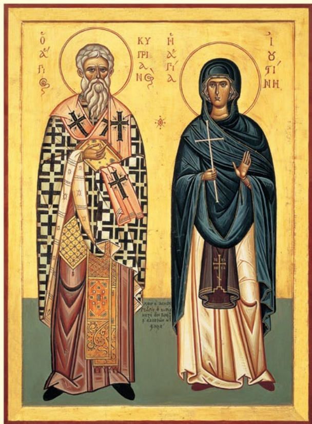
Οἱ Ἅγιοι Μάρτυρες Κυπριανὸς καὶ Ἰουστίνα. Φορητὴ Ἱερὰ Εἰκόνα, εὕρισκομένη στὸ παλαιὸ μικρὸ Καθολικὸ τῆς ὁμώνυμου Ἱερᾶς Μονῆς στὴν Φυλὴ Ἀττικῆς. «Χεὶρ καὶ δέησις» Γεωργίου τοῦ Κυπρίου, μαθητοῦ τοῦ μακαριστοῦ Φωτίου Κόντογλου (1961). Διαστάσεις 64 x 88 ἐκ.