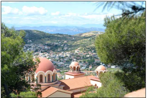
Άπόψεις τῆς Ἱερᾶς Μονῆς τῶν Ἁγίων Κυπριανοῦ καὶ Ἰουστίνης.