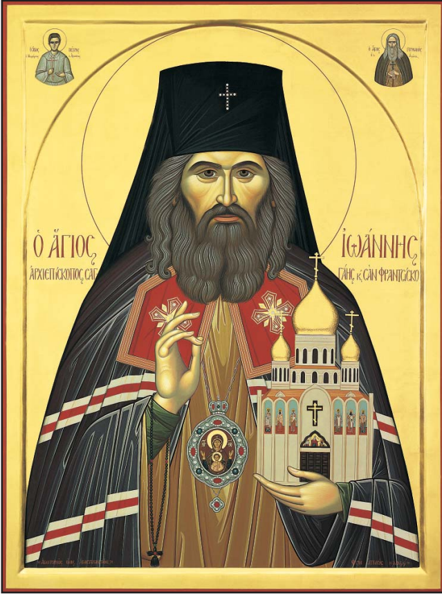
Ὁ Ἅγιος Ἰωάννης (Μαξίμοβιτς)